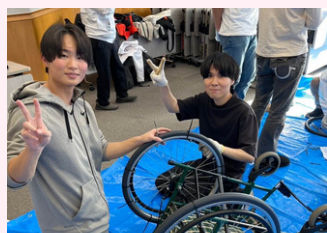
空飛ぶ車いす修理会